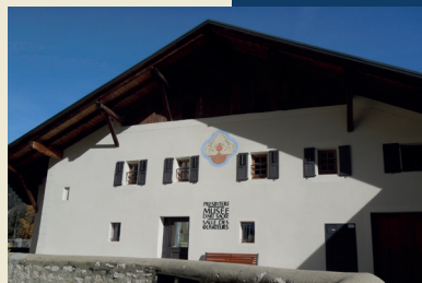
MUSÉE D'ART SACRÉ DE SAINT-NICOLAS DE VÉROCE INAUGURÉ EN 2010