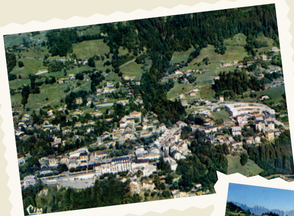
COMMUNE DE SAINT-GERVAIS (LE BOURG), ANNÉES 1970

Quand certains ont vu cette date comme une fin, d'autres l'ont considérée comme un début, un élan pour la nouvelle commune de Saint-Gervais.