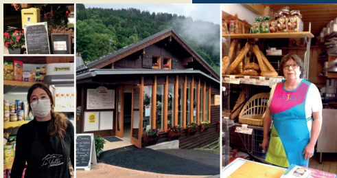
L'ÉPICERIE DU GALTA, 2020