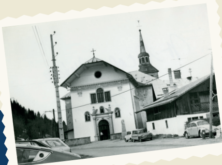
ÉGLISE DE SAINT-NICOLAS DE VÉROCE DANS LES ANNÉES 1970