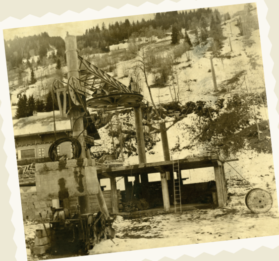
CONSTRUCTION DU TÉLÉSIÈGE DU CHEF LIEU DE SAINT-NICOLAS DE VÉROCE, ANNÉES 1970 FONDS JEAN-PAUL GAY, MAIRIE DE SAINT-GERVAIS

En 1977, le domaine skiable est repris par M. Ferrero, directeur de la Société d'Équipement Touristique de La Clusaz (SETLC), qui crée ensuite, en 1983, la Société d'Équipement du Mont-Joly (SEMJ), qui fusionne en 2017 avec la STBMA, présente sur le territoire depuis les années 2000 et qui modernise le domaine depuis.