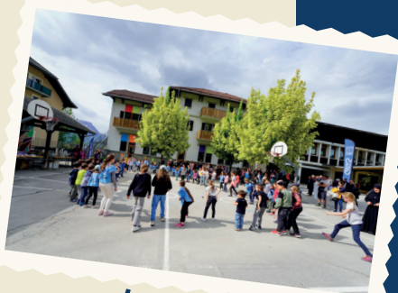
L'ÉCOLE DU FAYET APRÈS SA RÉNOVATION EN 2022