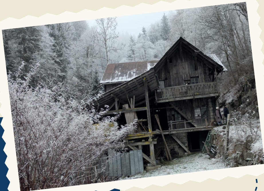
SCIERIE DU TARCHET, 2020

Située à la frontière des deux anciennes communes, séparées historiquement par le torrent du Tarchet, la scierie est aujourd'hui le trait d'union entre les deux communes.