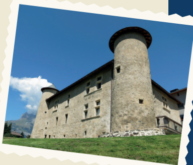
MAISON FORTE DE HAUTETOUR, INAUGURÉE EN DÉCEMBRE 2012