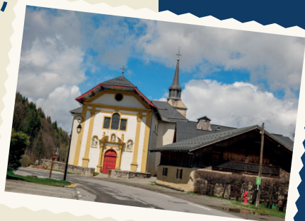
ÉGLISE DE SAINT-NICOLAS DE VÉROCE EN 2023