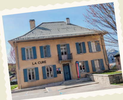
LA CURE, CENTRE CULTUREL DE SAINT-GERVAIS INAUGURÉ LE 17 DÉCEMBRE 2022