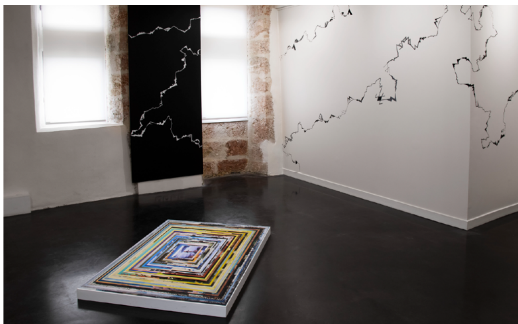
VUE DE L'ATELIER, ESPACE D'EXPOSITION EXPOSITION BIRD-WATCHERS