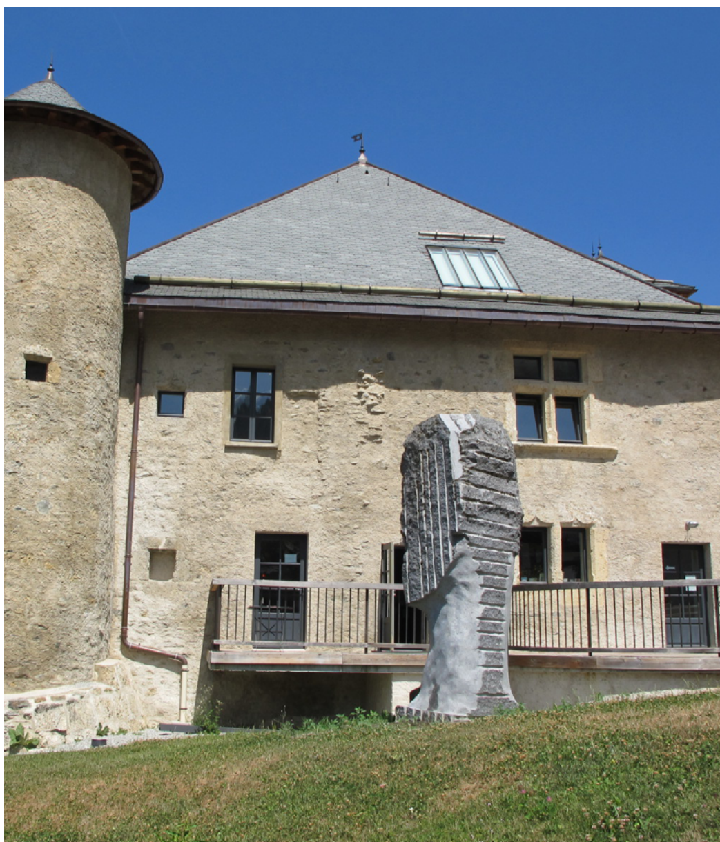
Maison forte de Hautetour, Sculpture : Le Guide - Denis Monfleury